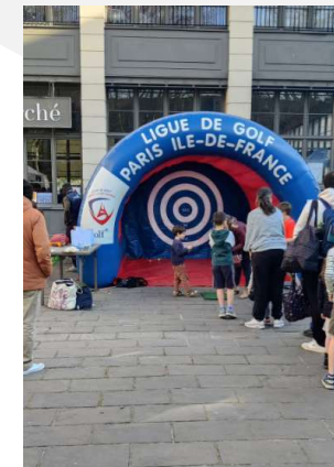
Chaville place du marché